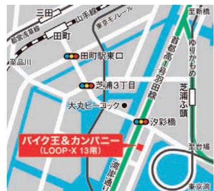
JR線「田町」駅 シャトルバス5分/徒歩12分 ゆりかもめ「芝浦ふ頭」駅 徒歩5分