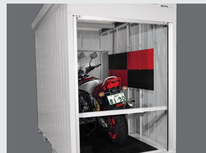
バイク王ガレージ