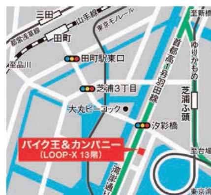
JR線「田町」駅 シャトルバス5分/徒歩12分 ゆりかもめ「芝浦ふ頭」駅 徒歩5分