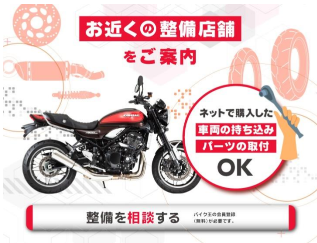
公式 HP イメージ